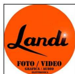
Landi Marco Foto Video