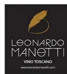
Azienda Agricola Leonardo Manetti