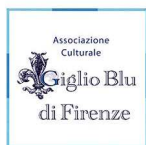
Associazione Culturale Giglio Blu di Firenze