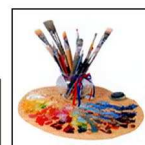
La Bottega dell'Arte di Montevarchi